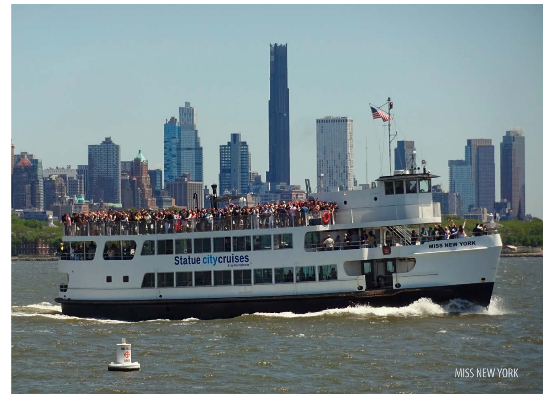
MISS NEW YORK