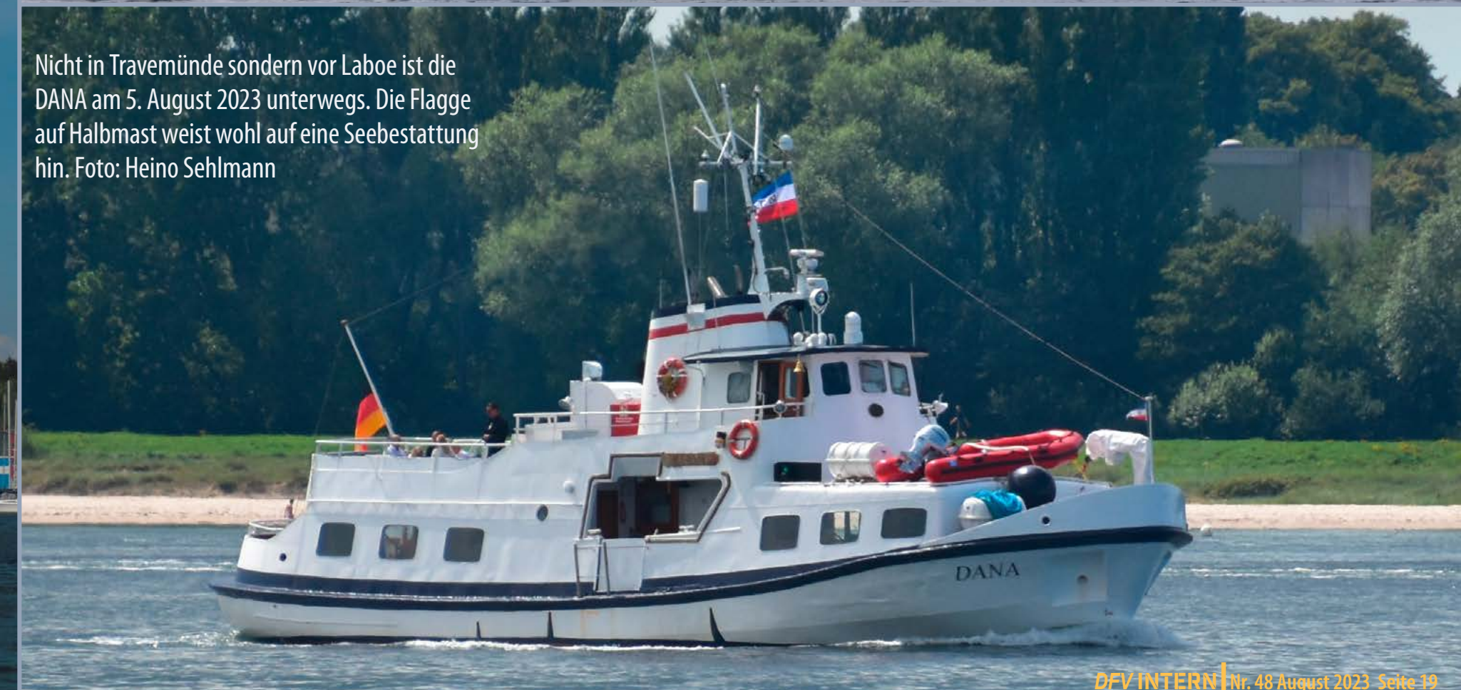
Nicht in Travemünde sondern vor Laboe ist die DANA am 5. August 2023 unterwegs. Die Flagge auf Halbmast weist wohl auf eine Seebestattung hin.