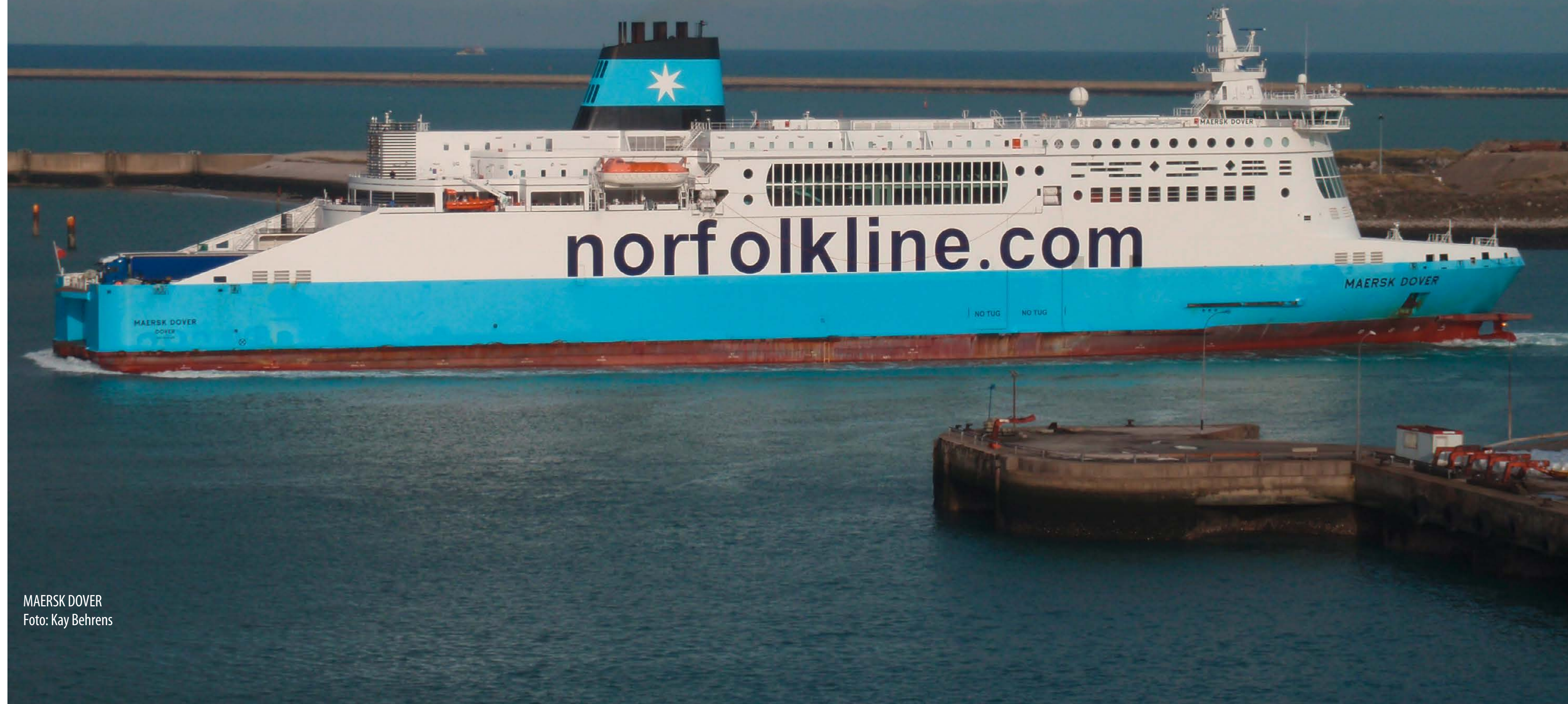
MAERSK DOVER

Vor zehn Jahren schmückte der DFV-Fotokalender „Abfahren und Ankommen“ die Wände von Hobbyecken, Büros oder Fluren. Kay Behrens nahm das Thema sehr wörtlich und schickte uns u.a. ein Bild, auf dem ausschließlich Kielwasser zu sehen war. Dieses Foto füllte dann die im Vorjahr noch weiß gebliebene Rückseite. Wir zeigen hier wieder drei Fotos, für die sich kein freier Monat fand.