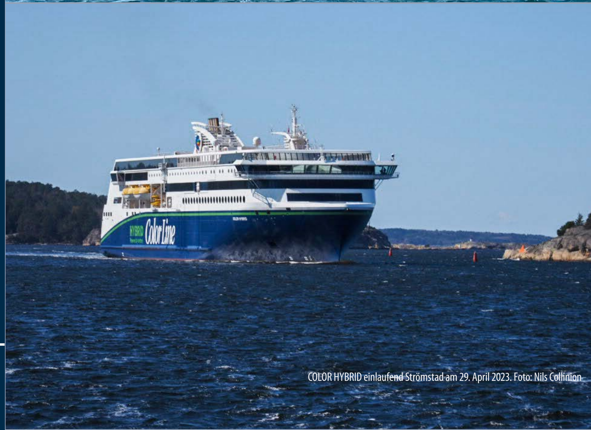
COLOR HYBRID einlaufend Strömstad am 29. April 2023.