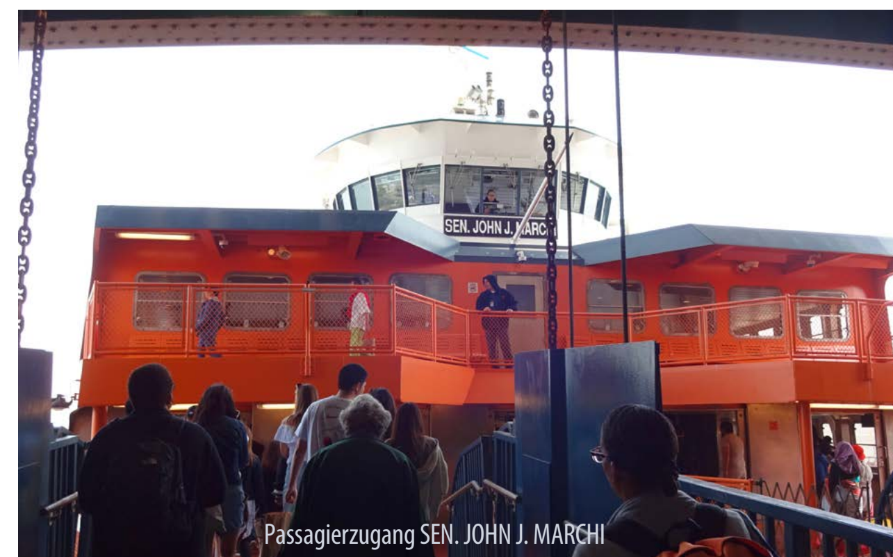
Passagierzugang SEN. JOHN J. MARCHI