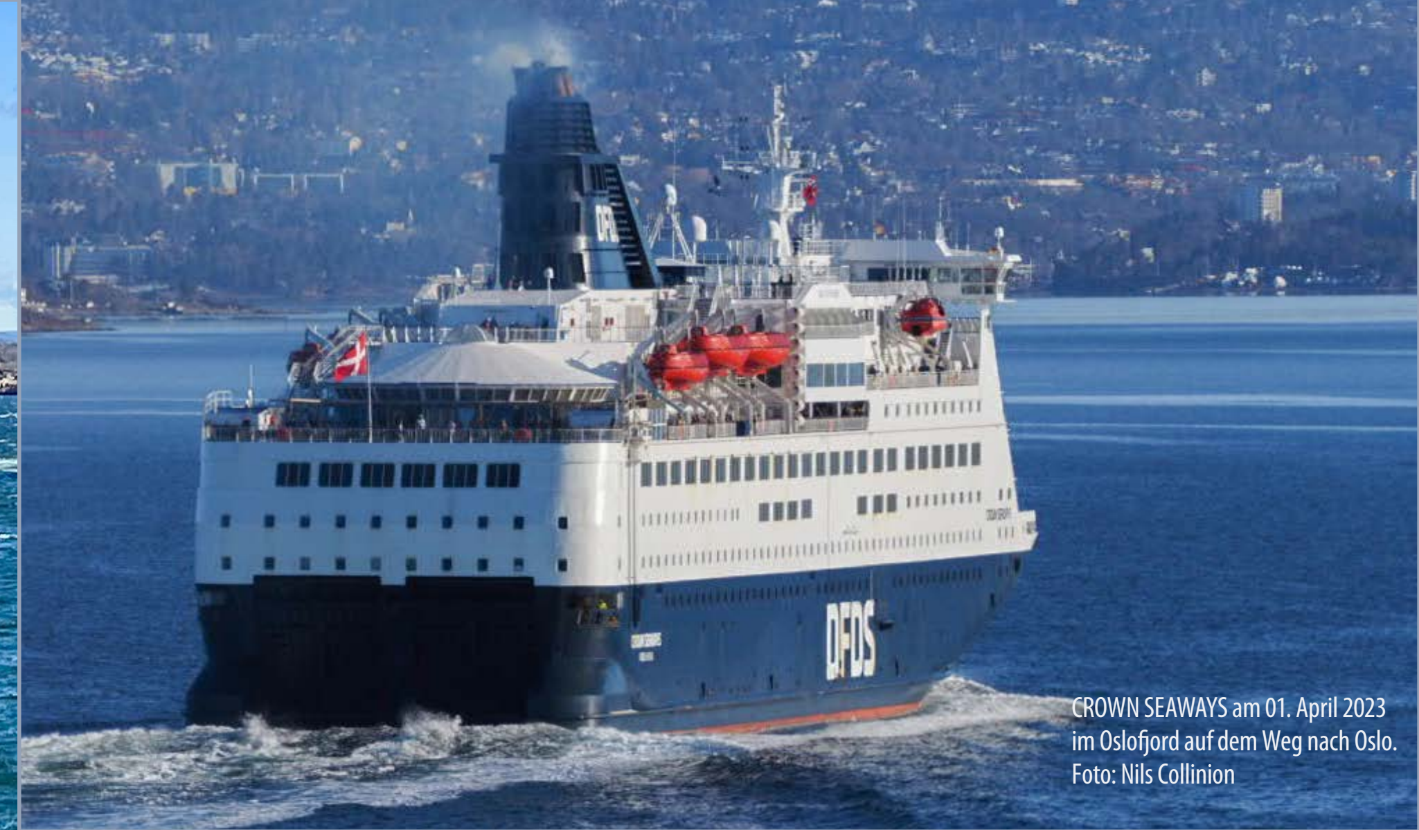
CROWN SEAWAYS am 01. April 2023 im Oslofjord auf dem Weg nach Oslo.