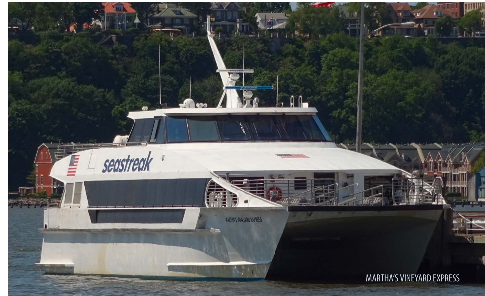
MARTHA'S VINEYARD EXPRESS

Ebenfalls von der Südspitze Mannhattans, genau genommen vom Battery Maritime Building direkt neben dem Whitehall Terminal, startet eine weitere Verbindung mit einem Doppelender. Sieben Minuten dauert die Überfahrt für 4 USD zur ehemaligen Gouverneurinsel.