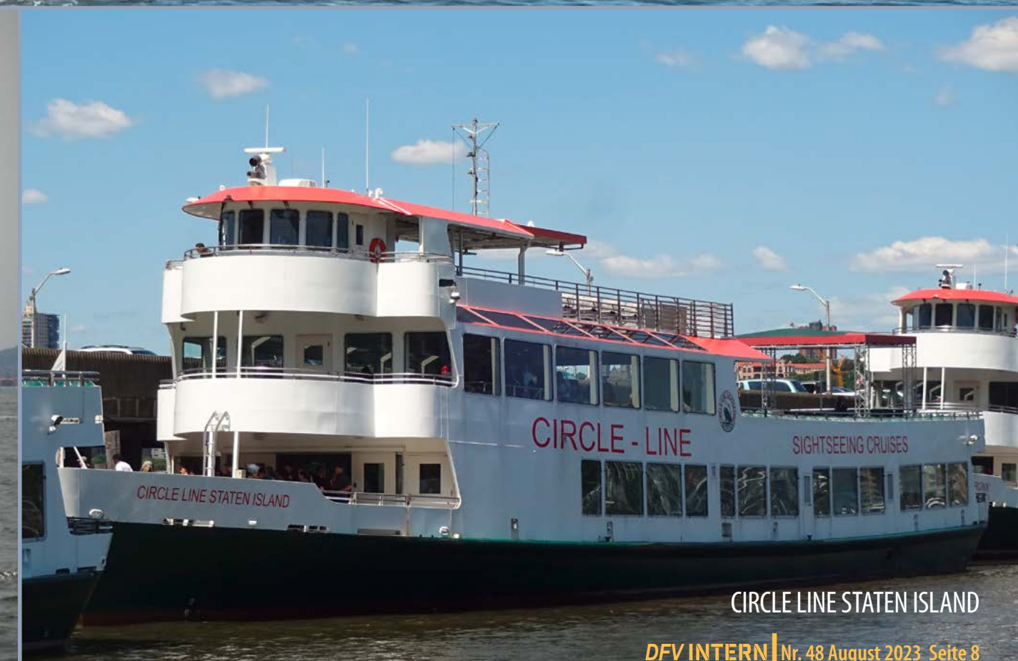
CIRCLE LINE STATEN ISLAND