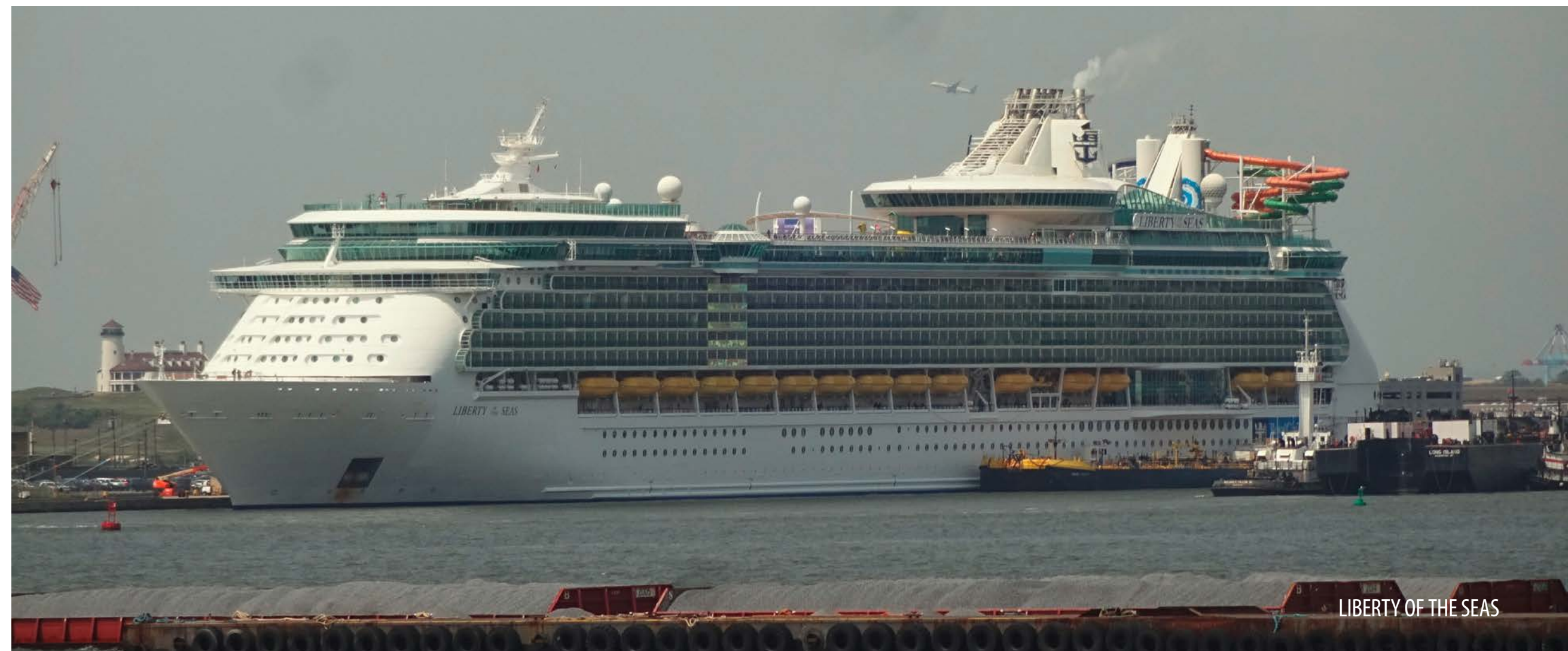
LIBERTY OF THE SEAS