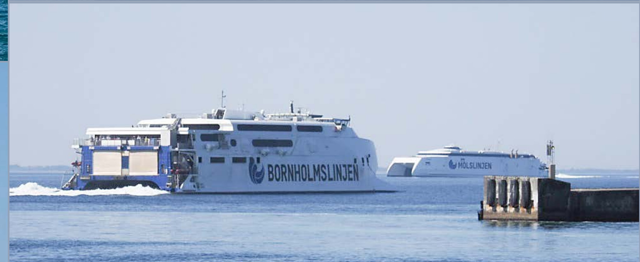
MAX, noch mit dem Bornholmslinjen - Schriftzug, verlässt am 13. Mai 2023 Sjællands Odde in Richtung Elbetoft. EXPRESS 4 kommt aus Aarhus.