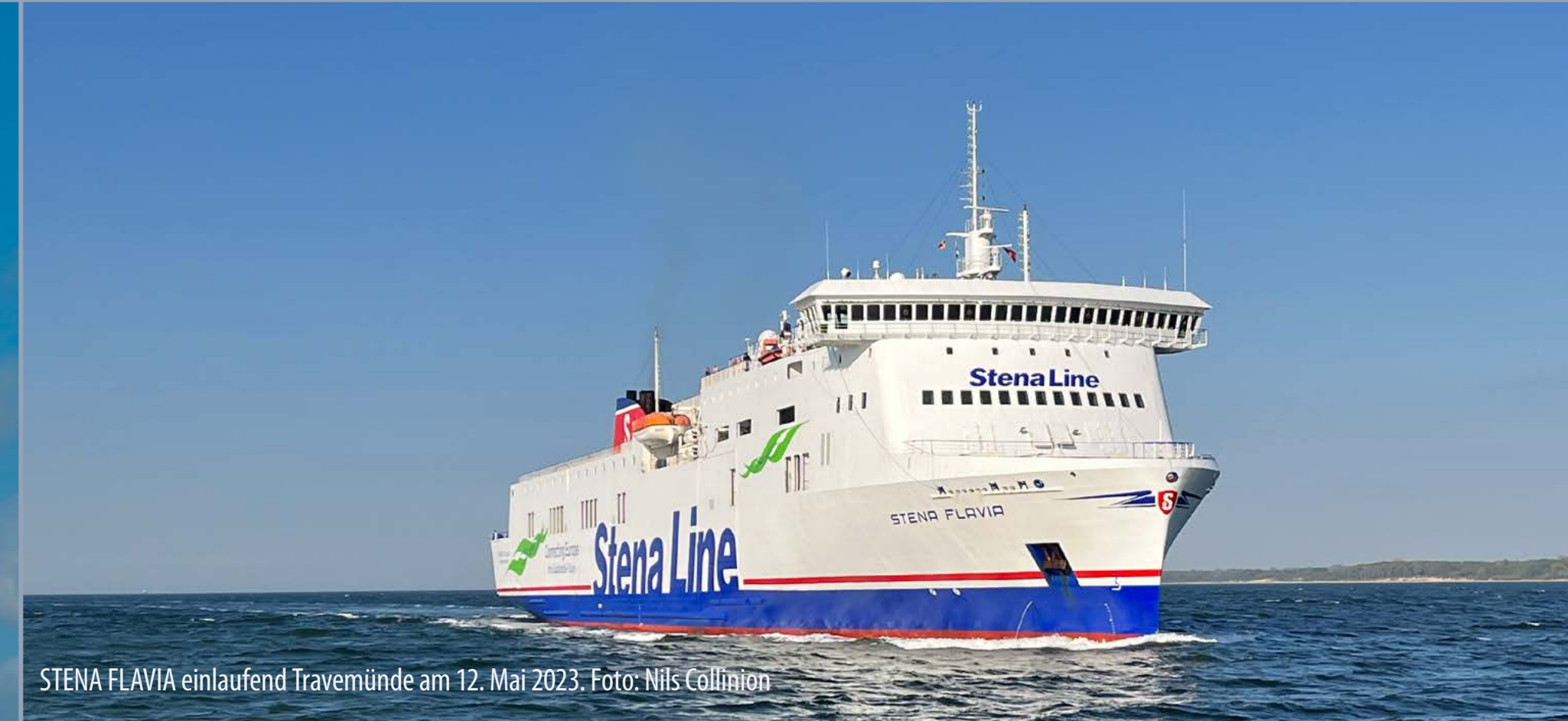
STENA FLAVIA einlaufend Travemünde am 12. Mai 2023.