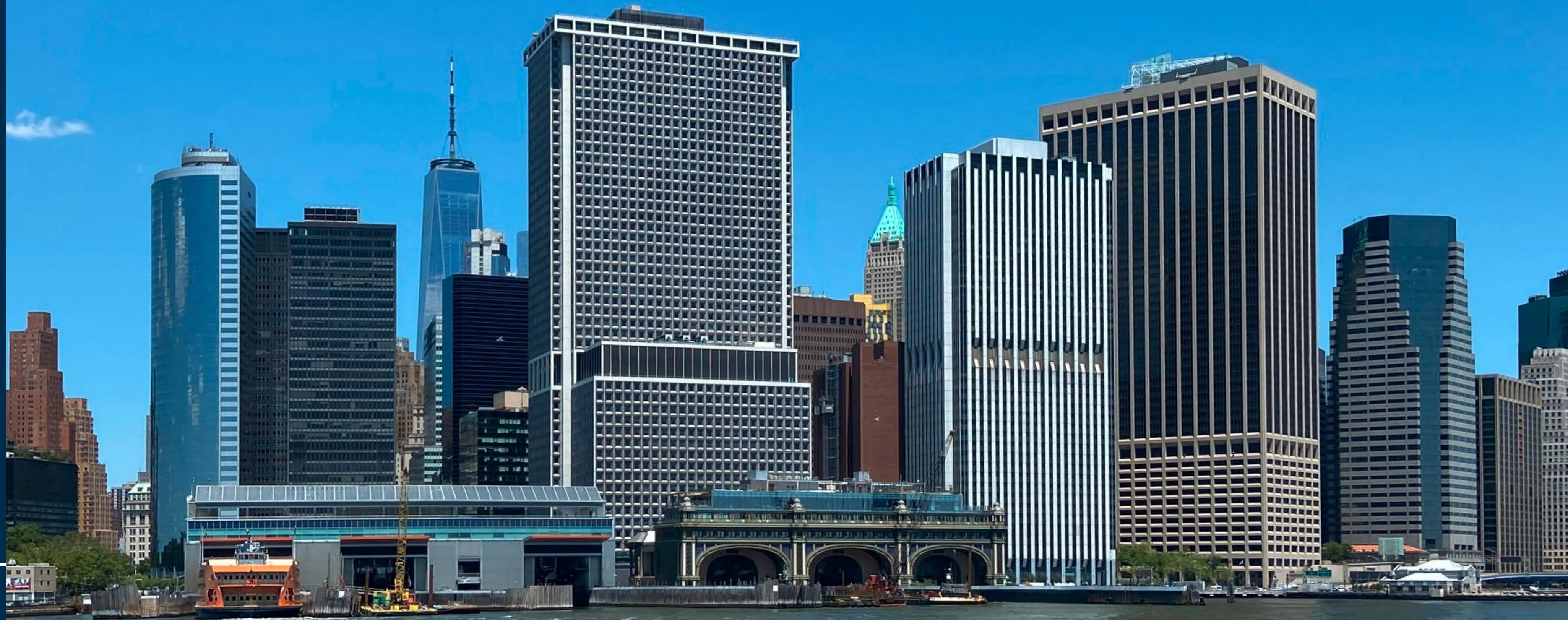
Staten Island Ferry Terminal und Battery Maritime Building