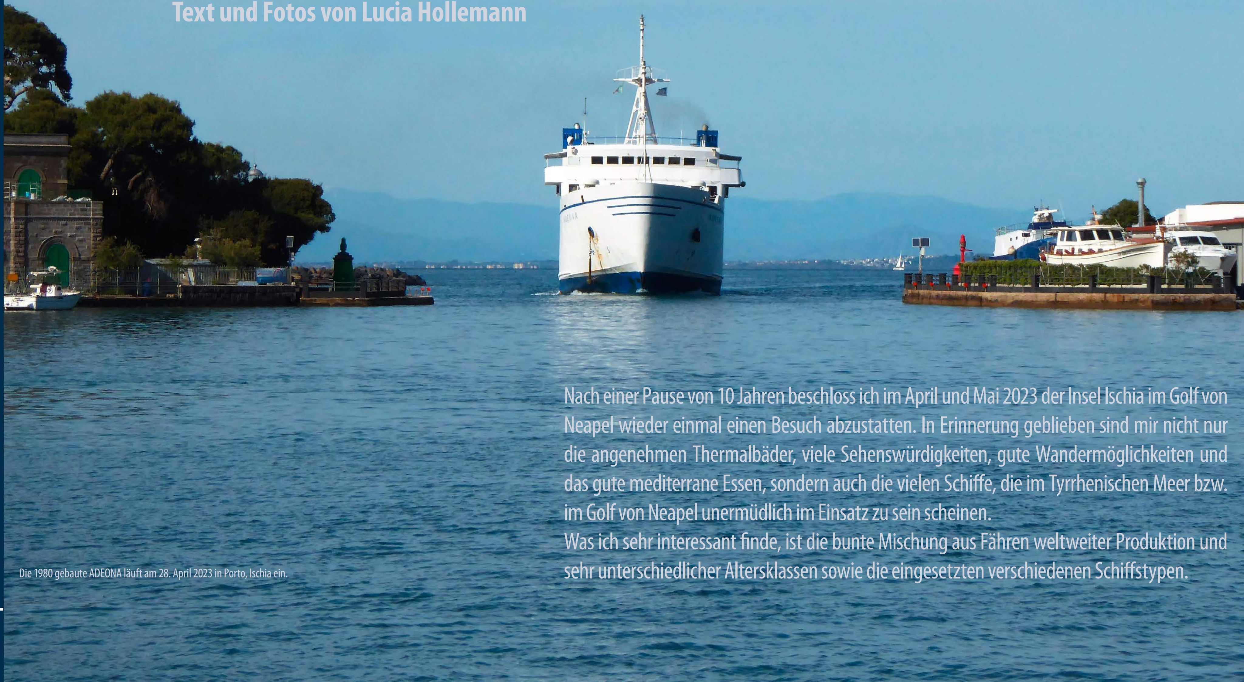
Die 1980 gebaute ADEONA läuft am 28. April 2023 in Porto, Ischia ein.

Nach einer Pause von 10 Jahren beschloss ich im April und Mai 2023 der Insel Ischia im Golf von Neapel wieder einmal einen Besuch abzustatten. In Erinnerung geblieben sind mir nicht nur die angenehmen Thermalbäder, viele Sehenswürdigkeiten, gute Wandermöglichkeiten und das gute mediterrane Essen, sondern auch die vielen Schiffe, die im Tyrrhenischen Meer bzw. im Golf von Neapel unermüdlich im Einsatz zu sein scheinen. Was ich sehr interessant finde, ist die bunte Mischung aus Fähren weltweiter Produktion und sehr unterschiedlicher Altersklassen sowie die eingesetzten verschiedenen Schiffstypen.