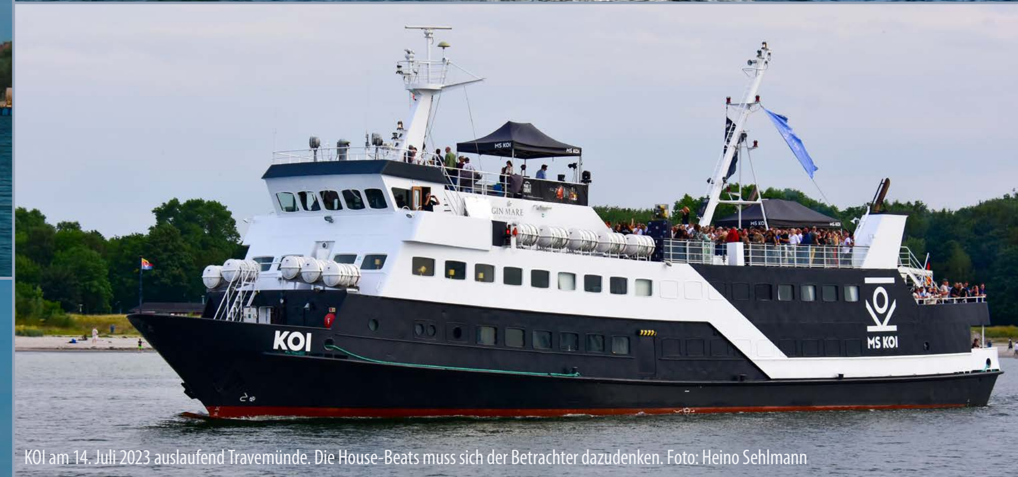
KOI am 14. Juli 2023 auslaufend Travemünde. Die House-Beats muss sich der Betrachter dazudenken.