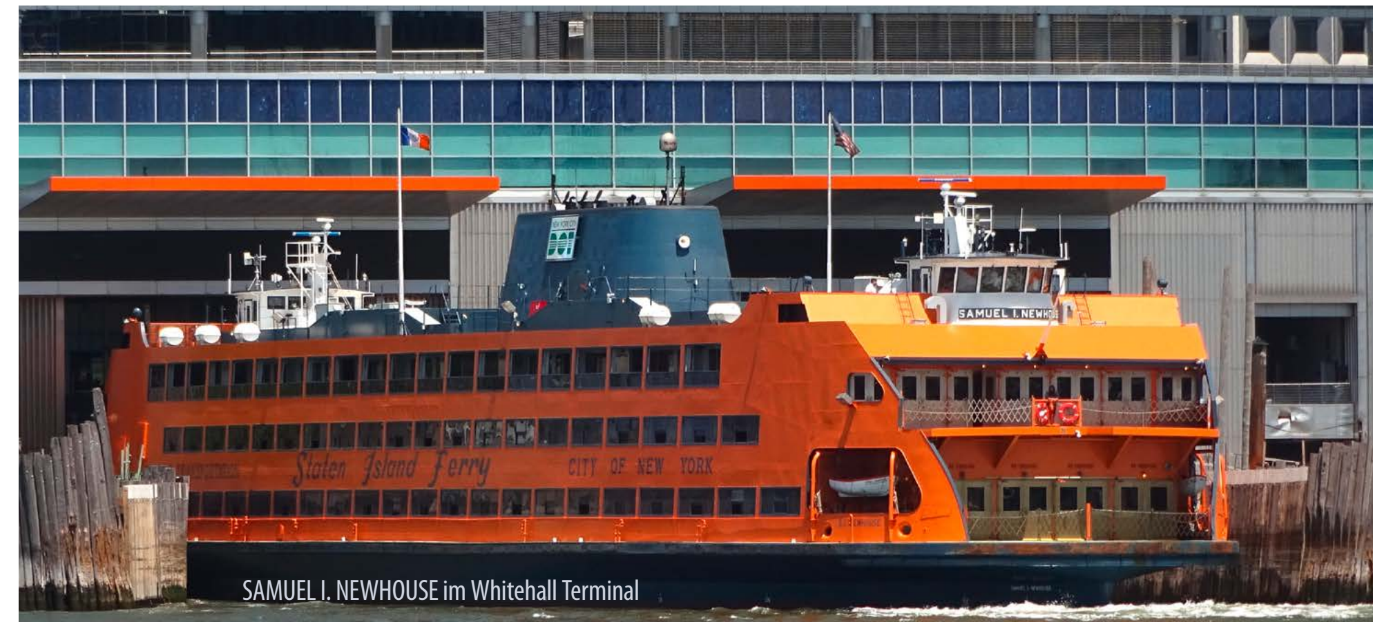
SAMUEL I. NEWHOUSE im Whitehall Terminal