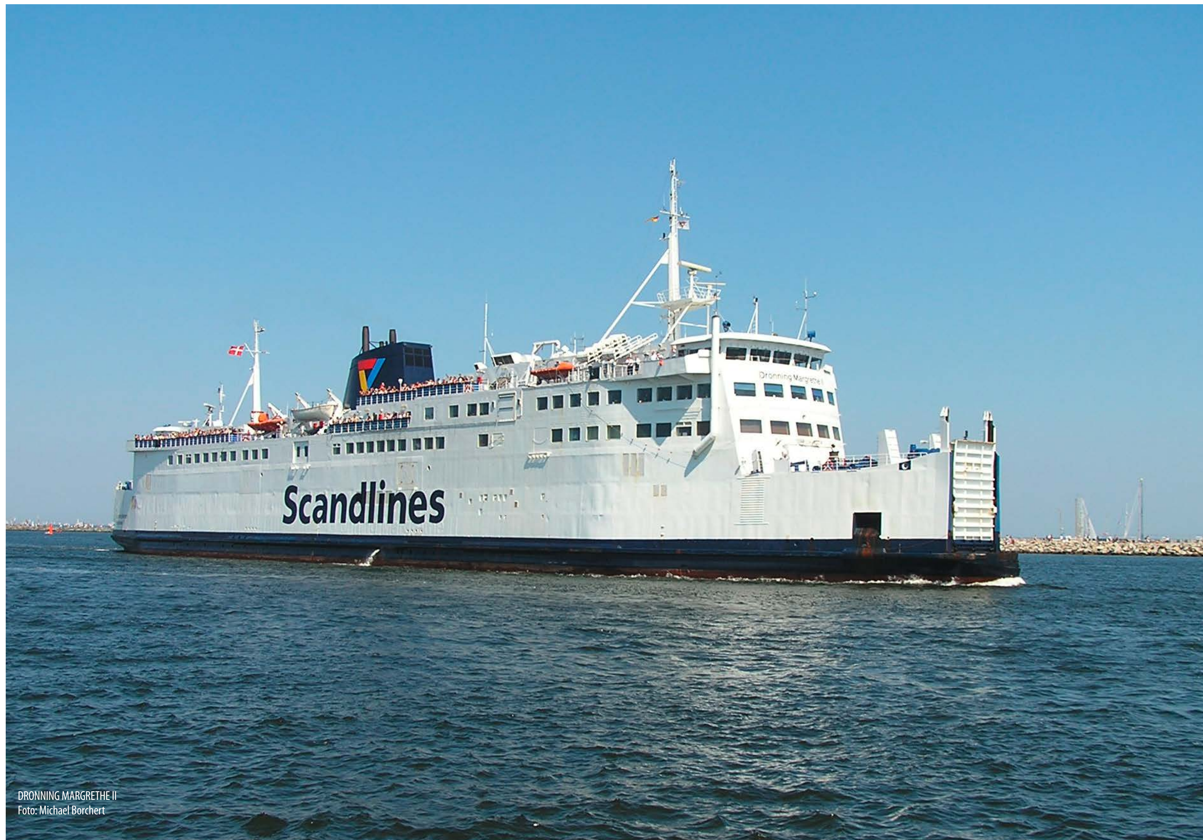
DRONNING MARGRETHE II