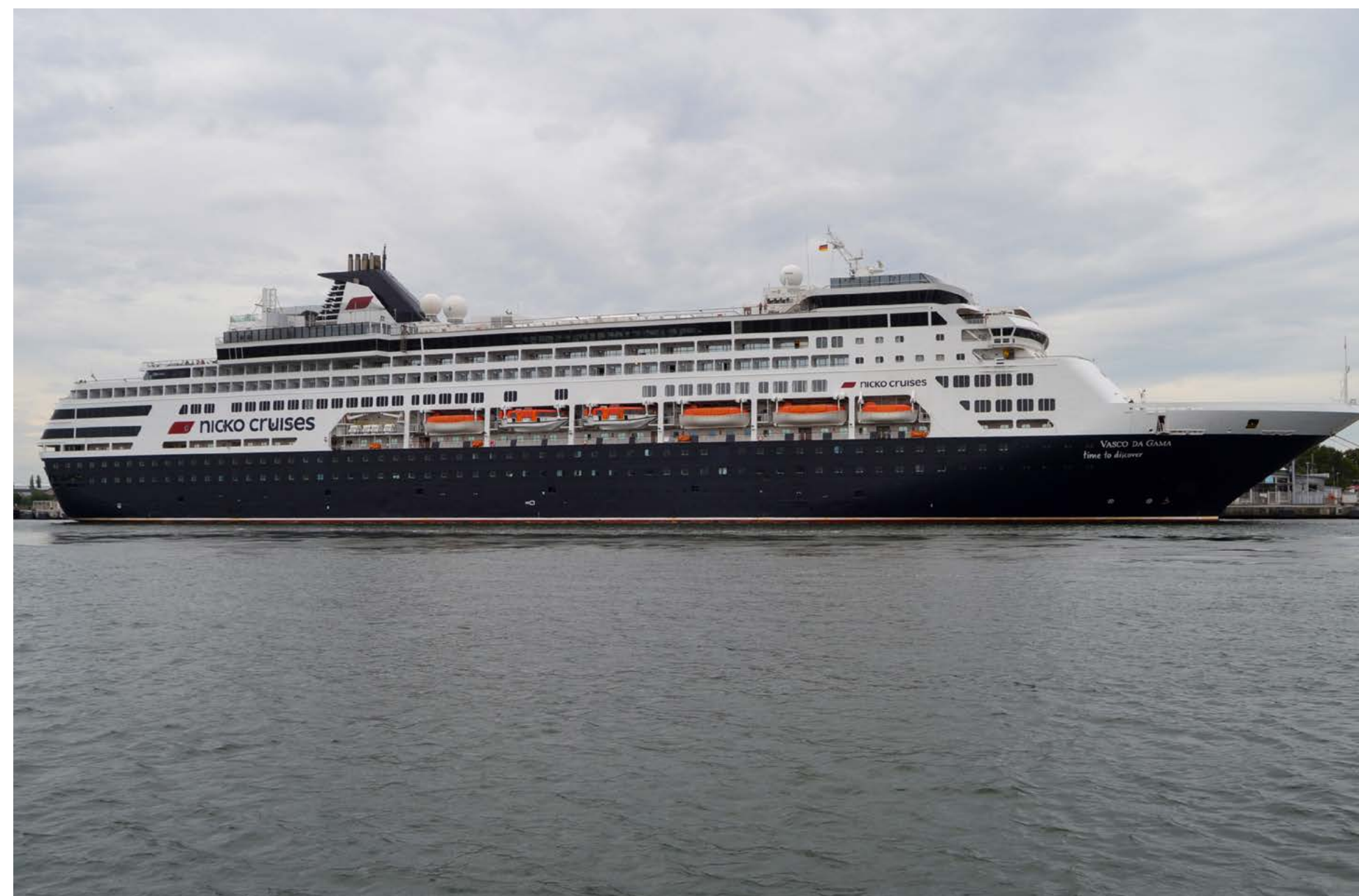
Die VASCO DA GAMA startete am 23. Juni 2023 von Warnemünde Richtung Norden.

Michael Borchert unternahm im Juni 2023 eine Kreuzfahrt nach Island. In Warnemünde startend, machte die VASCO DA GAMA in Göteborg, Akureyri, Reykjavik und Bergen Station. Dabei sind ihm einige Fähr- und Kreuzfahrtschiffe vor die Linse gekommen.