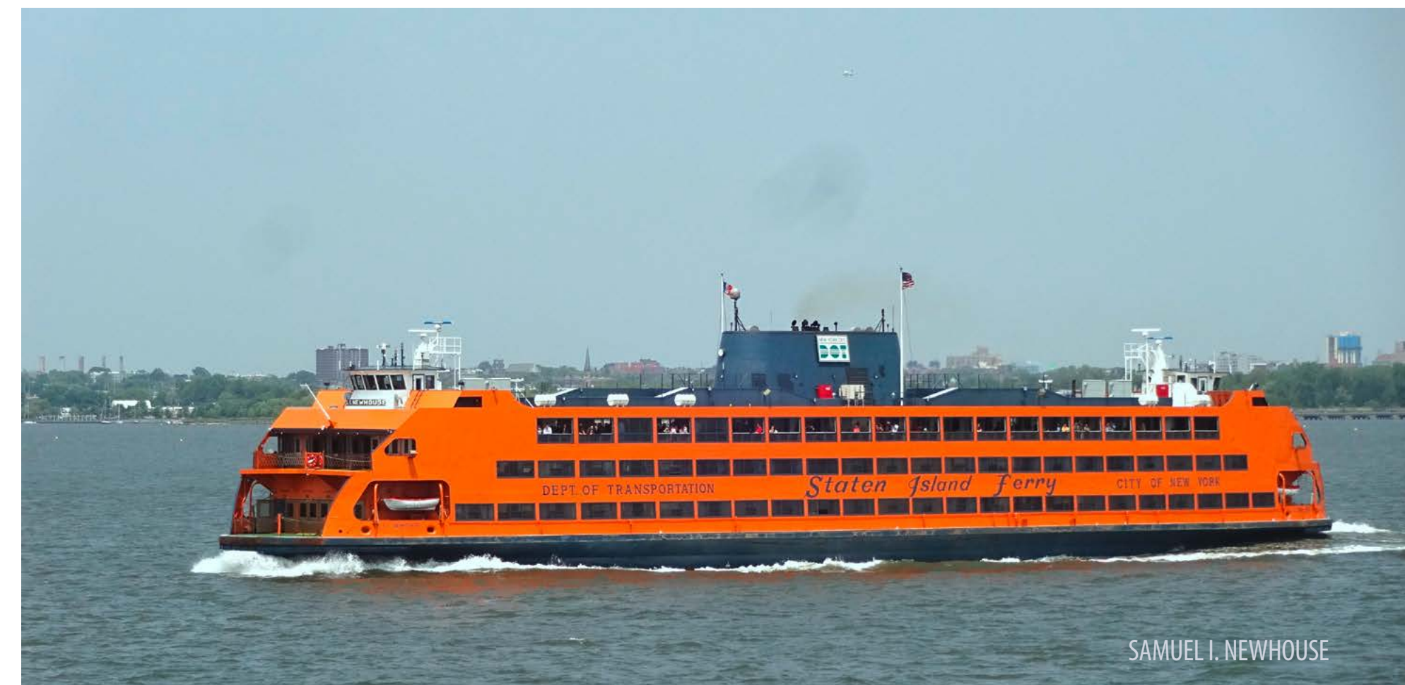
SAMUEL I. NEWHOUSE