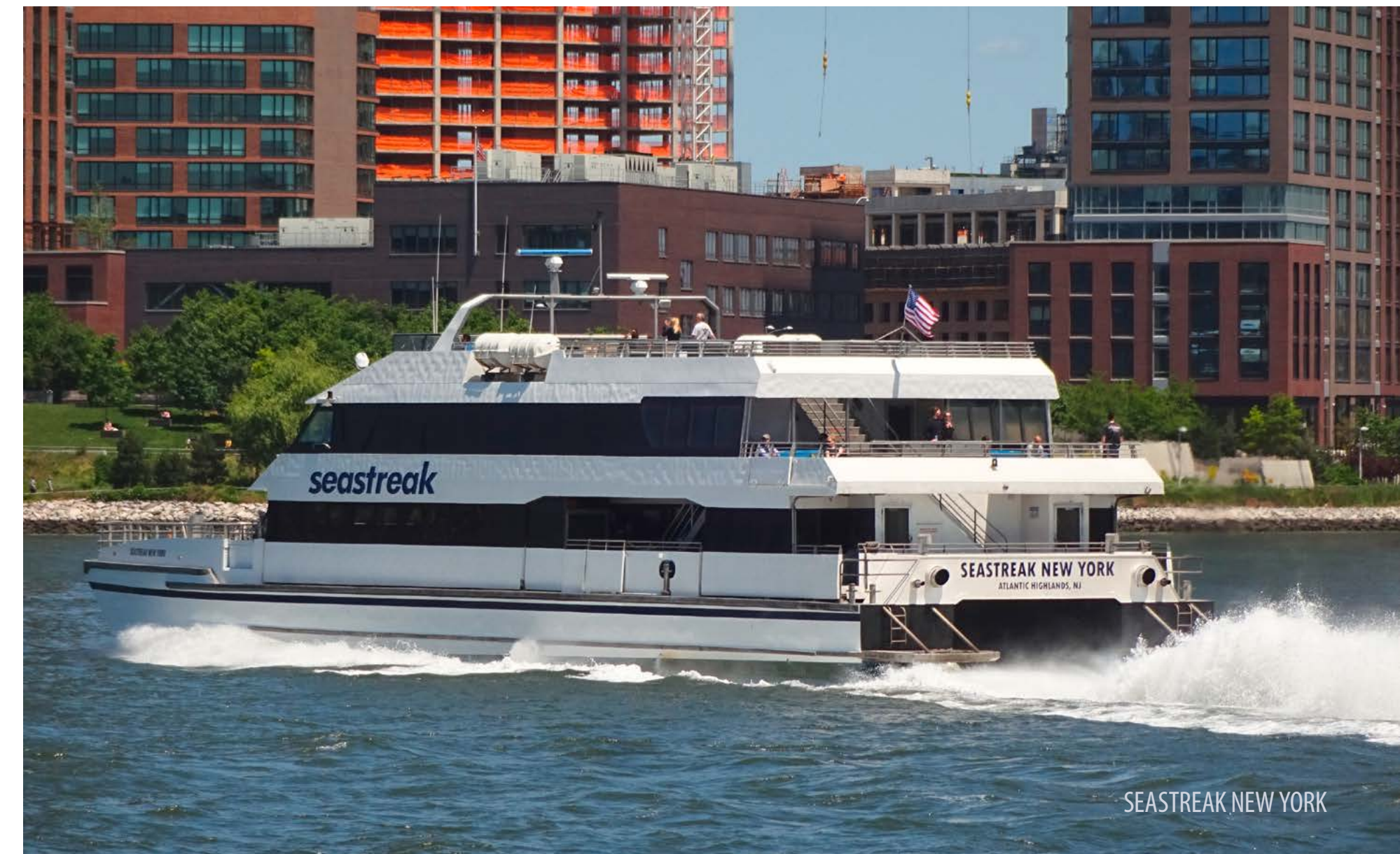
SEASTREAK NEW YORK