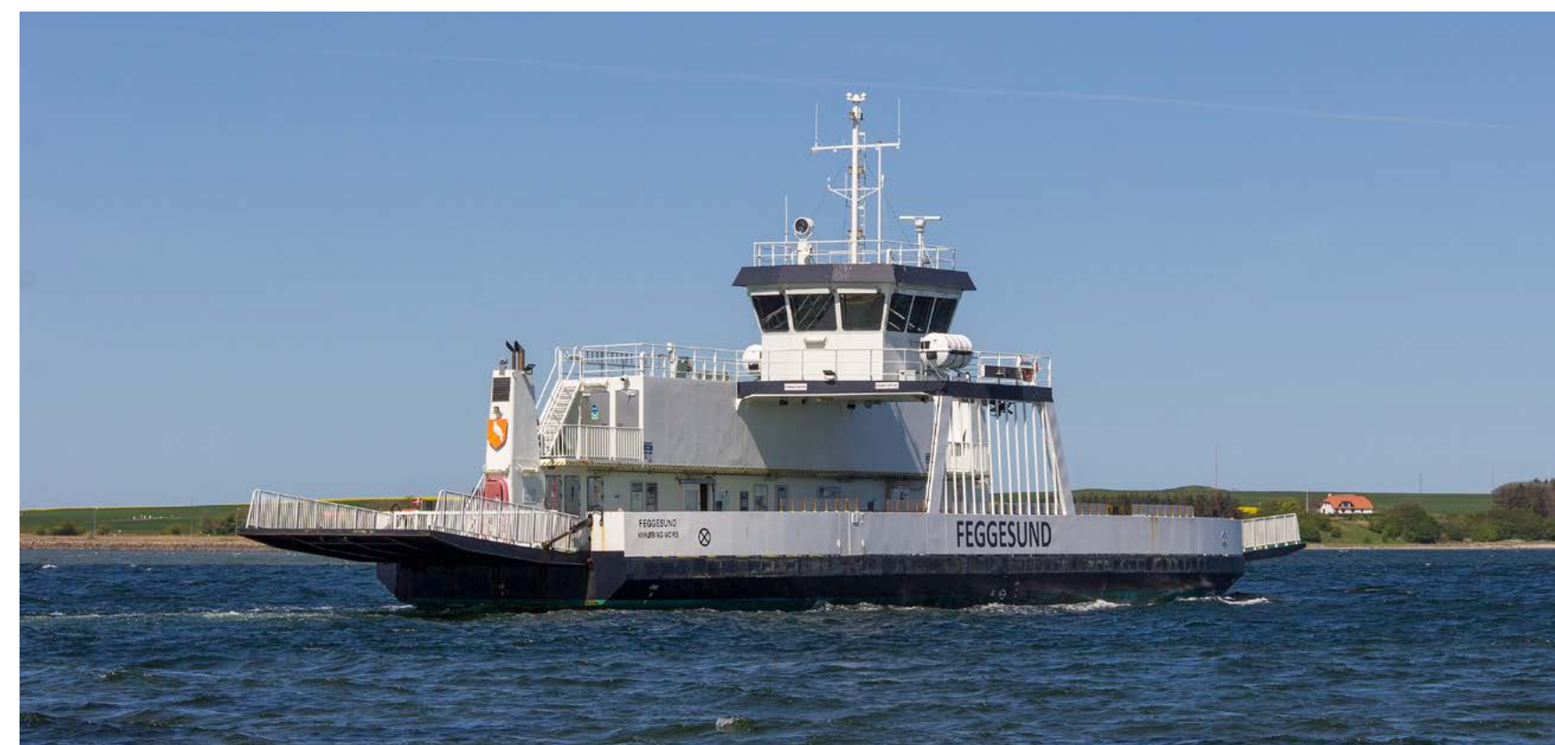
Die FEGGESUND quert das gleichnamige Wasser und verbindet so die Gemeinden Thisted und Morsø. Ein Wappen der jeweiligen Gemeinde zielt die Schornsteine des Doppeldeckers.