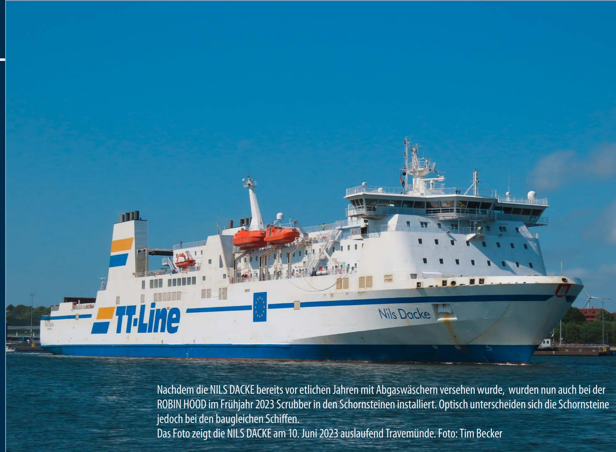
Nachdem die NILS DACKE bereits vor etlichen Jahren mit Abgaswäschern versehen wurde, wurden nun auch bei der ROBIN HOOD im Frühjahr 2023 Scrubber in den Schornsteinen installiert. Optisch unterscheiden sich die Schornsteine jedoch bei den baugleichen Schiffen. Das Foto zeigt die NILS DACKE am 10. Juni 2023 auslaufend Travemünde.