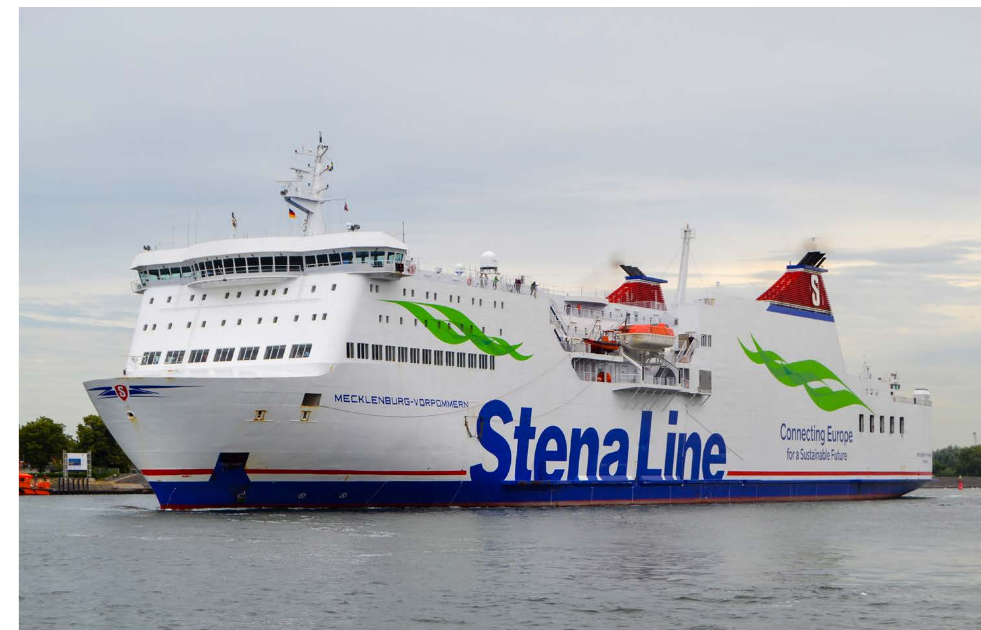
Vor dem Check-in noch schnell ein paar Fotos am Rostocker Seekanal: TINKER BELL (oben) und MECKLENBURG-VORPOMMERN (unten) auslaufend.