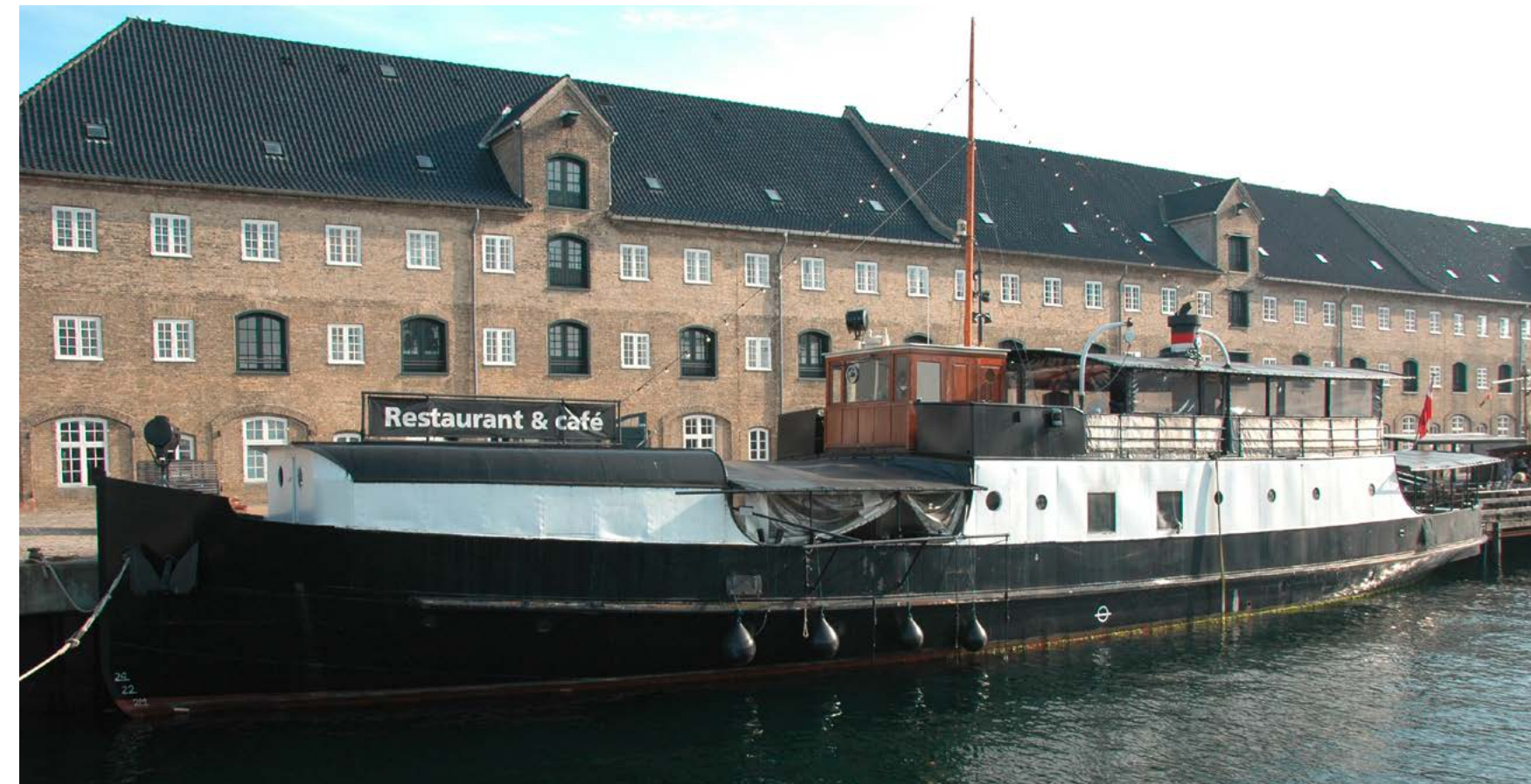
Wer sich den Traum vom eigenen schwimmenden Restaurant oder Wohnschiff erfüllen möchte: Für umgerechnet etwas mehr als 1 Mio Euro kann man zur Zeit die FÆRGEN ELLEN kaufen.