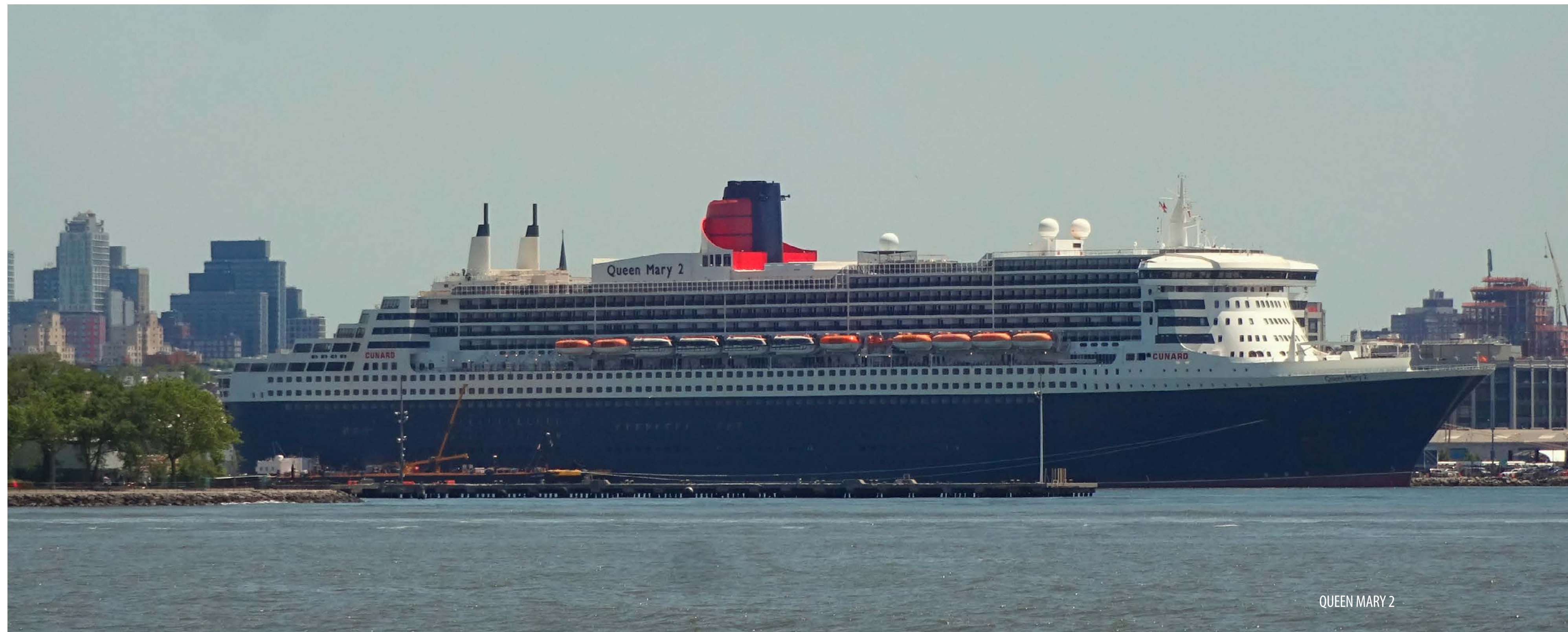
QUEEN MARY 2