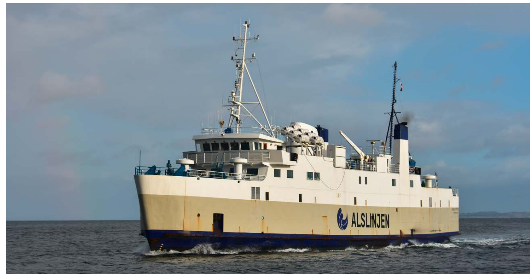
In der Saison 2024 wird die FRIGG SYDFYEN noch als Verstärkerschiff zwischen Fynshav und Bøjden pendeln. Ob der Plan ihrer Erhaltung als Museum oder Restaurant aufgeht, wird sich zeigen.