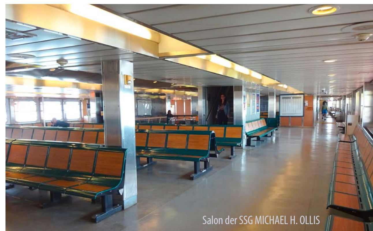
Salon der SSG MICHAEL H. OLLIS