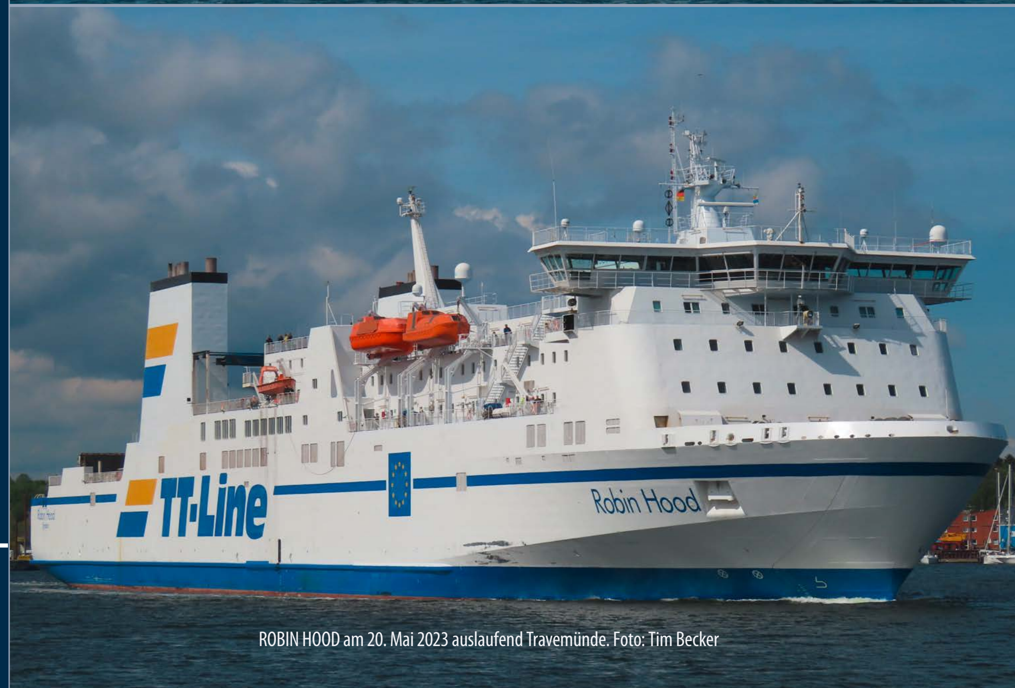
ROBIN HOOD am 20. Mai 2023 auslaufend Travemünde.