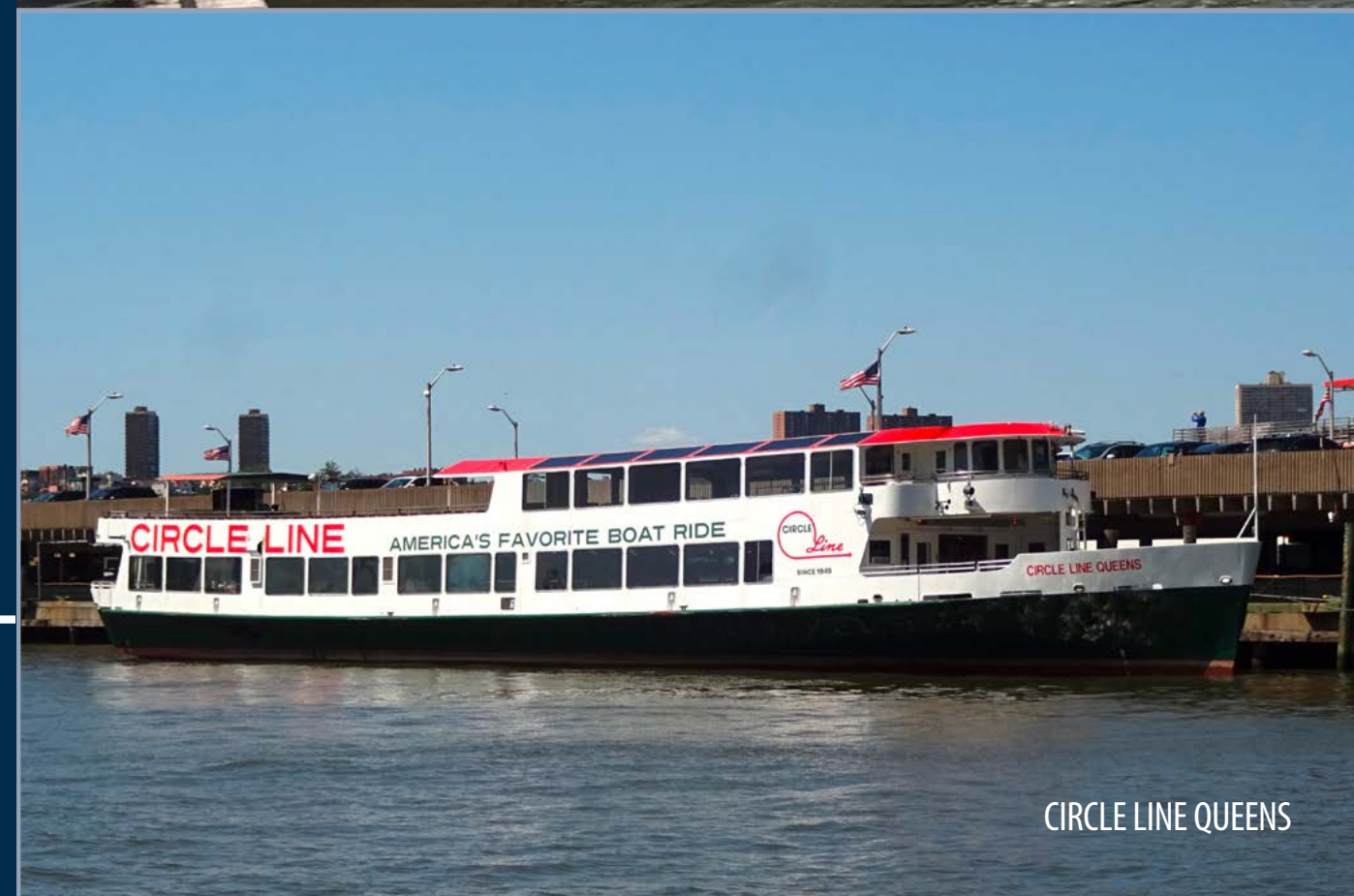
CIRCLE LINE QUEENS