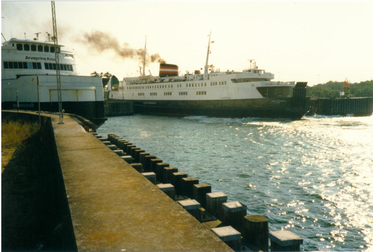
Der Fährhafen von Halskov bei Korsør (Dänemark) 1990 und 2011.