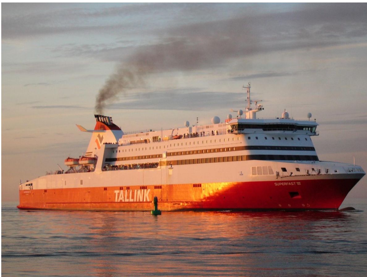
Nicht mehr allzu lange wird die SUPERFAST VII den Rostocker Hafen anlaufen wie auf diesem Bild vom 27. Juli 2011. R. C. Schöttker