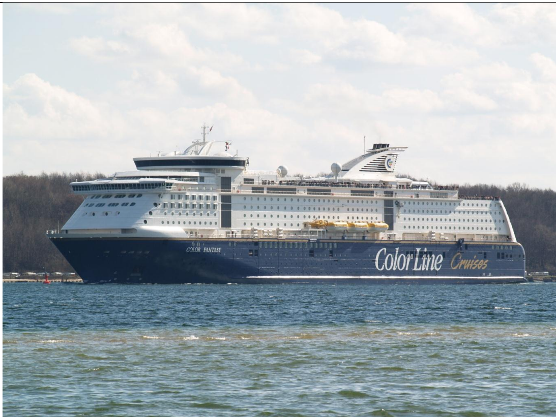
Am 2. April 2010 erwischte Marcel Brech die COLOR FANTASY .